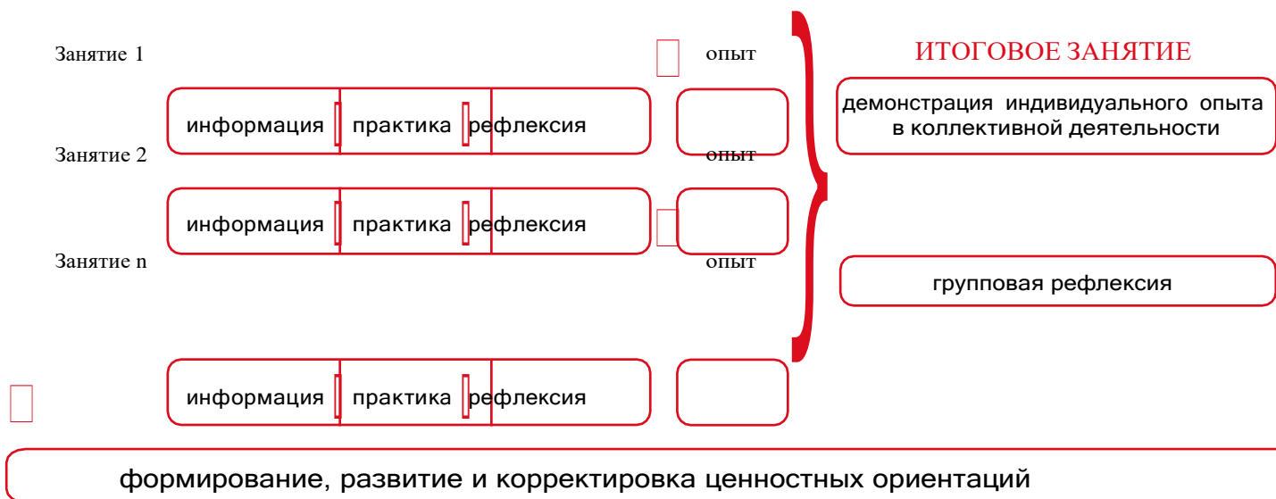
СХЕМА ОРГАНИЗАЦИИ СОБЫТИЯ

По окончании всех событий проводится итоговая игра, на которой дети демонстрируют полученные в течение учебного года знания и умения, подводят коллективные и индивидуальные итоги.